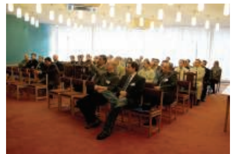
Uczestnicy warsztatów technicznych, Tarnów 7-8 czerwca 2006

Warsztaty były okazją do podzielenia się wiedzą telekomunikacyjną iqCST z operatorami TVK i ISP. Ta wiedza pozwoli im świadomie wdrażać usługi VoIP w swoich sieciach bez biznesowych i technicznych obaw i błędów. W trakcie warsztatów iqCST gościła przedstawicieli Gawex Media, Dominas Consulting Group, Slican, SEP i Contec, każdy z nich wygłosił prezentację dotyczącą wiodącego tematu warsztatów.